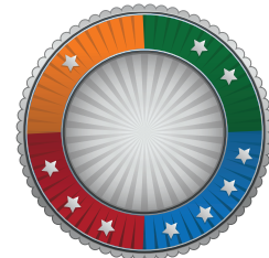
MEDIKRO® Garanti och service